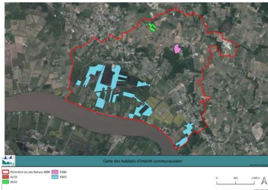
Figure 3 : Cartographie provisoire des habitats d'intérêt communautaire du site

Ce travail nécessite encore quelques ajustements sur la caractérisation des habitats naturels et de leur état de conservation, notamment sur l'habitat 6210 Pelouses sèches à orchidées ; l'habitat 6510 Prairies maigres de fauche, l'habitat 9180 Forêt de pentes et de ravins à Tilleul et Erable et l'habitat 91F0 Forêt de chênes et de frênes des grands fleuves.